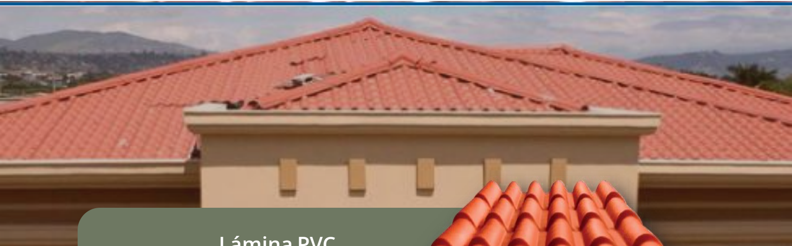
Lámina PVC ULTRATEJA