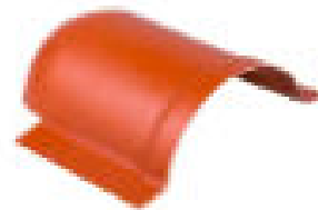
CIERRE DE CUMBREIRA